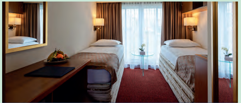
Zwei-Bett-Kabine, Oberdeck mit französischem Balkon