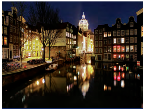
Basilika St. Nikolaus in Amsterdam