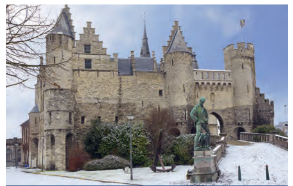
Steen Castle in Antwerpen