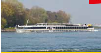
MS ELEGANT LADY

Neu: Alle Kabinen im frischen Look und französischen Balkonen auf dem Oberdeck