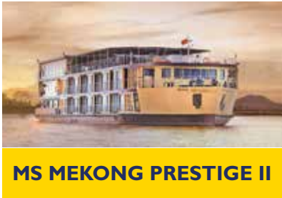
MS MEKONG PRESTIGE II