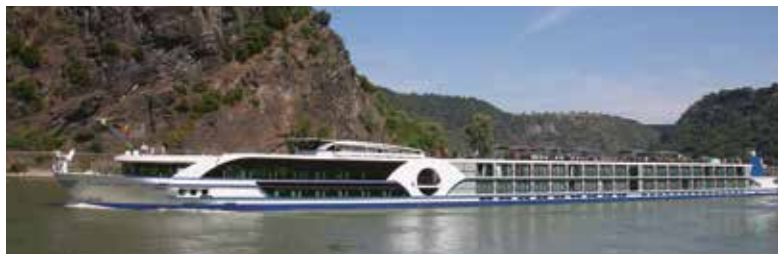
SILVESTERREISEN MIT MS THOMAS HARDY