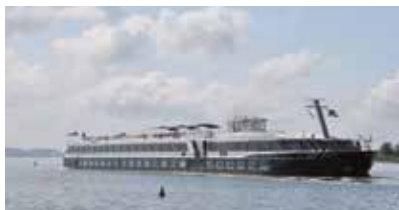
MS SANS SOUCI