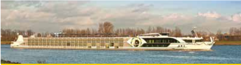
SILVESTERREISEN MIT MS INSPIRE UND MS GRACE